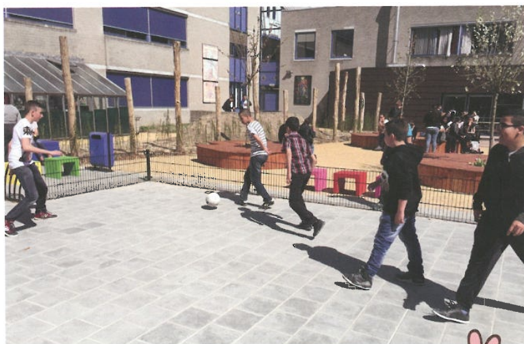
Op het groene schoolplein heeft iedere groep heeft zijn eigen ruimte.

Een betegeld schoolplein wordt vaak ingenomen door voetballende jongens. Dit drijft de andere kinderen naar de hoeken en randen van het plein. Door zones te creëren voor actief en rustiger spel ontstaat voor iedere groep een eigen ruimte en worden de 'rechten' op de ruimte eerlijker verdeeld. Dit kan door variatie in begroeiing, bestrating, hoogteverschillen en bebouwing. Zo'n groen schoolplein kan daardoor veel meer zijn dan een pauzeplaats of een overblijfplek. Het wordt meer een buitenlokaal met dieren, planten en bomen waar kinderen weer in contact komen met de natuur. Waar ze verstoppertje kunnen spelen, kunnen klimmen en klauteren. Op een groen schoolplein draait het even niet meer om de letters pc en tv, maar om de letter n van natuur. Dat is belangrijk voor een gezonde ontwikkeling. Een gezond