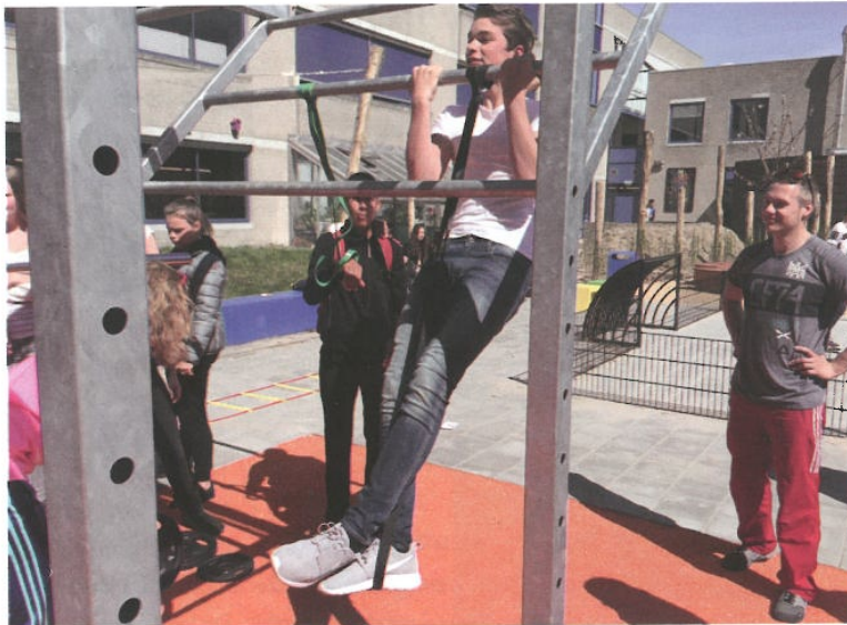
De leerlingen van het Kandinsky College maken intensief gebruik van de bootcamp op het schoolplein.